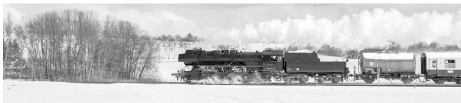
Natürlich hoffen wir für unsere Adventsfahrten auf eine schneebedeckte Oberlausitz bei herrlichem Winterwetter.

In der zweiten Dezemberhälfte wird unsere Dampflok Löbau zeitweilig verlassen und für das Sächsische Eisenbahnmuseum Chemnitz-Hilbersdorf auf Lichtfahrten gehen. Das eigene Dampfross der Chemnitzer Eisenbahnfreunde muss leider Anfang November mit Fristablauf abgestellt und einer neuen Hauptuntersuchung unterzogen werden, sodass wir uns dort gern für die Unterstützung bei der Reparatur unserer Giesla Anfang dieses Jahres revanchieren. Währenddessen planen wir bereits fleißig am Sonderfahrtprogramm für das Jahr 2024. Ohne schon zu viel verraten zu wollen: Wir wollen die neuen grenzüberschreitenden Freiheiten unserer Fahrzeuge natürlich nicht ungenutzt lassen. Weitere Termine, Informationen sowie die Möglichkeit zu Buchung unserer Sonderfahrten finden Sie wie immer unter www.osef.de auf unserer Internetseite. (Ostsächsische Eisenbahnfreunde e. V.)